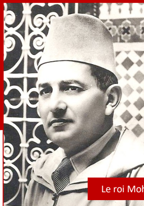
Le roi Mohammed V